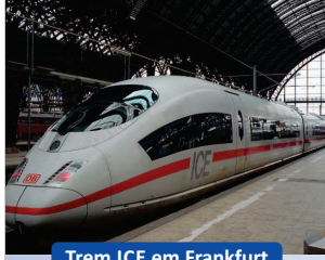
Trem ICE em Frankfurt