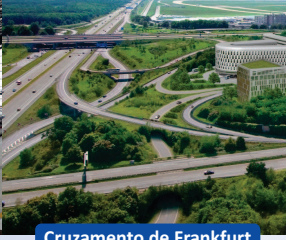
Cruzamento de Frankfurt