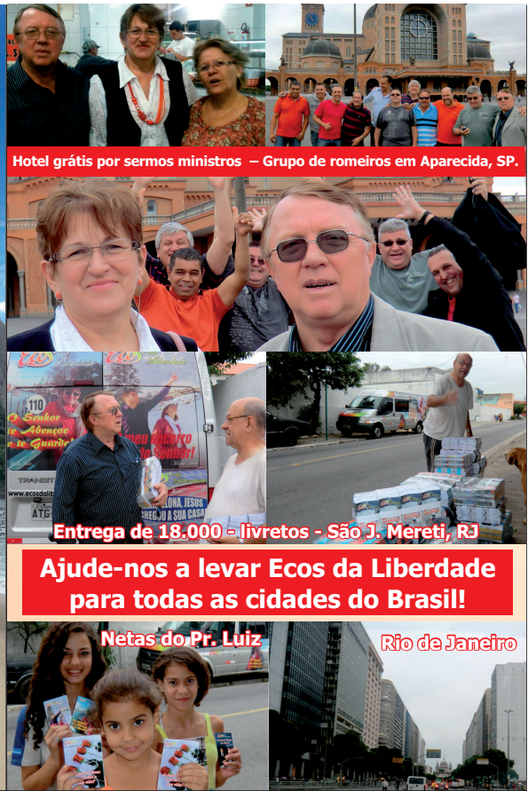
Hotel grátis por sermos ministros – Grupo de romeiros em Aparecida, SP.