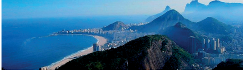
Vista da Guanabara do Pão de Açúcar.

alguns evangélicos conseguiram escapar e outros foram condenados à morte por Nicolas D Villegaignon, enforcados e atirados de um despenhadeiro, em 1558.