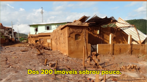
Dos 200 imóveis sobrou pouco.