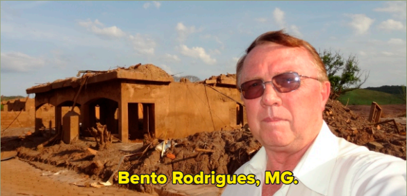
Bento Rodrigues, MG.