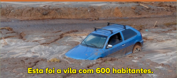
Esta foi a vila com 600 habitantes.