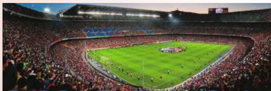
Estádio Camp Nou - Barcelona - Espanha