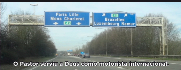
O Pastor serviu a Deus como motorista internacional.