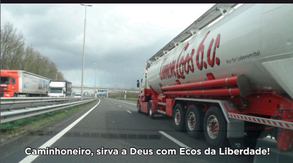
Caminhoneiro, sirva a Deus com Ecos da Liberdade!