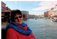
Piazzetta Giovanni XXIII

Viajamos no barco que funciona como ônibus circular, pelo rio que corta a cidade e fomos até a praça de São Marcos: