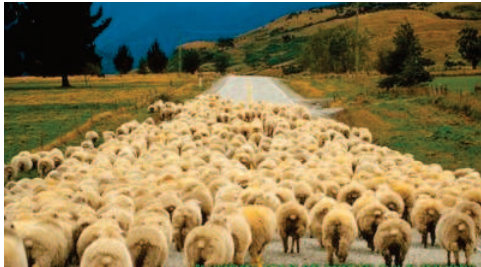
O Portal para o Paraíso