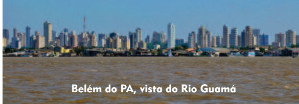
Belém do PA, vista do Rio Guamá