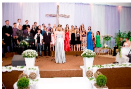
Grupo da Juventude

Em momentos de dificuldades, leia este livreto duas ou três vezes. Clame por ajuda de Deus, e escreva-nos partilhando de suas tristezas e vitórias.