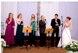
Noivos com seus irmãos

“...Tome cuidado e viva de acordo com toda a Lei... Não te desvie dela em nada e você terá sucesso... Seja forte e corajoso! Não fique desanimado nem tenha medo, porque eu, o Senhor seu Deus estarei com você... Jos. 1: 7-9.