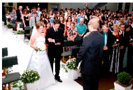
Recepção no Altar